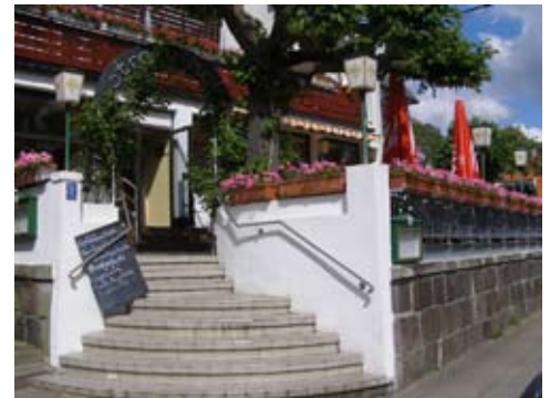
Fischrestaurant am Strandweg (Blankenese):

Beim Spaziergang am Strandweg in Hamburg-Blankenese erblickte der Herausgeber diese schöne Gaststätten-Terrasse, welche zum Einkehren einlud. Da die angebotene Scholle mit Speck an diesem Tage besonders günstig war, gab ich dem Herzen einen Stoß und bestellte sie mir. Es gab sogar zwei Schollen zum Preis von einer.