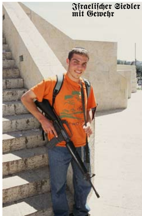
Israelischer Siedler mit Gewehr

Wie die letzten 30 Jahre gezeigt haben, blühen die Siedlungen wie die Wohlfahrtsstaatskontrakte. Sie bieten ganz gewöhnlichen Leuten, was sie sonst im eigentlichen Israel—innerhalb der Grenzen von 4. Juni 1967—sich nicht leisten könnten: billiges Land, große Wohnungen, Vergünstigungen, Unterstützungen, viel Platz, weiten Blick, ein sehr gutes Straßennetz und gute Schulen. Selbst für jene Juden, die nicht dorthin umgezogen sind, erweitern die Siedlungen ihren Horizont und zeigen eine Möglichkeit, um sozial und wirtschaftlich aufzusteigen. Diese Möglichkeit ist viel realer als die vagen Versprechungen von Frieden, Verbesserungen, eine unbekannte Situation. Der Frieden würde auch den Sicherheitsvorwand — um palästinensische Israelis zu diskriminieren — wenn nicht völlig, so doch etwas reduzieren: bei der Landverteilung, Entwicklung von Ressourcen, bei der Bildung, bei der Anstellung im Gesundheitswesen, bei den bürgerlichen Rechten (Heirat und Staatsbürgerschaft). Leute, die daran gewöhnt sind, Privilegien in einem auf ethnischer Diskriminierung beruhenden System zu haben, sehen seine Außerkräftigung als eine Bedrohung ihres Wohlbefindens.