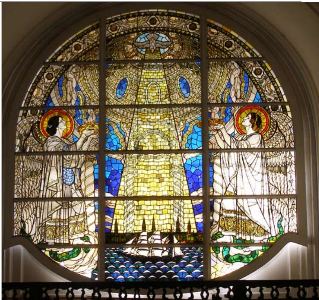
Ausgießung des Heiligen Geistes. Glasfenster in St. Michaelis, Hamburg

Die Römer hatten gerade eine Statue der Juno erobert, und jetzt mußte man nicht, was damit geschehen sollte. Das Nicken der Statue, welche sich zum Abtransport auf den Schultern einiger Römer befand, nahm man als Zeichen, daß die Statue mit Recht nach Rom geschafft und dort würdig untergebracht werden sollte. (Die Vernichtung einer solchen Statue, wie es später unter den Christen geschah, hätte