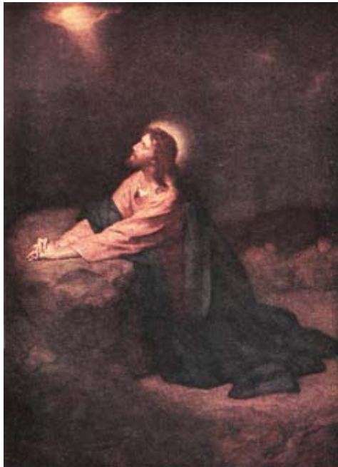
Christus in Gethsemane (1890)

1853 kehrte Hofmann nach Darmstadt zurück und zu Beginn des Jahres 1854 starb seine geliebte Mutter. Ihr Tod bewegte ihn tief und inspirierte ihn, sein erstes größeres Werk mit religiöser Thematik zu