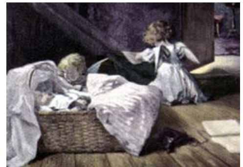
„Engelsbesuch“ von Clara Walther

konnte ich auf einmal wiedererkennen. Da war eine richtige Clique, die mich kannte, meine „50 Kinder“. Später wurde ich Leiter der „Nachhilfezentrale“, und so erkannte ich, daß meine Schüler damit gemeint waren. Einige, besonders meinen Lieblings-schüler, erkannte ich deutlich wieder. Manche Einzelheiten habe ich vergessen, aber ich erinnere mich immer mehr, je älter ich werde. Doch auch ein Gebäude in Hamburg habe ich wiedererkannt: den häßlichen schwarzen Kirchturm der Kirche in Dovenstedt. Da war ich sicher, daß ich eine gewisse Aufgabe hatte, die nur ich übernehmen durfte.