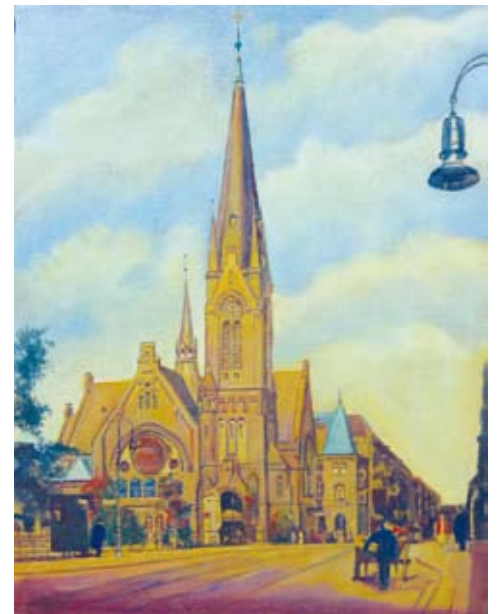
St.-Annen-Kirche in Hammerbrook an der Hammerbrook-Straße vor der Zerstörung (Gemälde von Gerhard Helzel)

An den Wänden hingen Gemälde von Hamburger Pastoren, die dort gewirkt hatten.