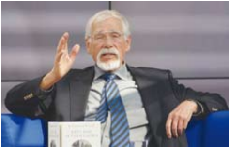
Johannes Fried

Der Historiker Johannes Fried glaubt, daß Jesus nicht am Kreuz gestorben sei, sondern nur ohnmächtig gewesen war. Er schrieb dazu ein Buch „Kein Tod auf Golgatha“, das völlig neue medizinische Einzelheiten über dieses heikle Thema bringt. Im „Focus“ erschien darüber ein größerer Artikel, wovon wir einige Auszüge bringen.