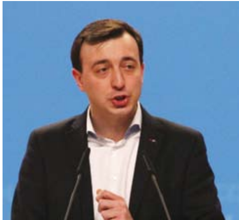
Paul Ziemiat

CDU-Generalsekretär Paul Ziemiat nannte das „irre“. Damit hätte die Partei gerade noch die Kurve kriegen können — mit der klaren Ansage: Das können wir als Partei nicht wollen!