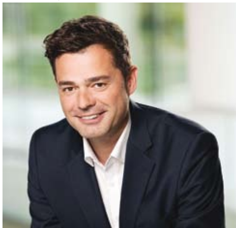
Mike Mohring.

CDU-Generalsekretär Paul Ziemiat nannte das „irre“. Damit hätte die Partei gerade noch die Kurve kriegen können — mit der klaren Ansage: Das können wir als Partei nicht wollen!