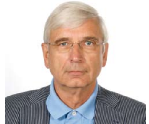
Joachim Wagner

„Die Macht der Moschee“: Ein erstaunlich ehrliches Buch, das jeder gelesen haben sollte, hat der frühere Leiter des MND-Hauptstadtstudios über die Migration geschrieben.