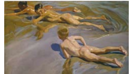
Abb.: Manneken Pis, Brüssels Wahrzeichen / Knaben am Strand (Joaquin Sorolla, 1863–1923)

Die ältere Generation durfte früher das jeweils andere Geschlecht nur als Kunstwerk (Gemälde, Plastik) sehen. Übertriebene und alberne Körperfurcht (Somatophobie) schüch-tert heute wieder Maler und Bildhauer ein. Mir wäre es recht gewesen, wenn ich als Knabe auch gefilmt usw. worden wäre, weil ich als Knabe auch gut ausfah.