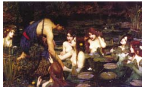
Hylas und die Nymphen (Gemälde von John William Waterhouse, 1896)

zeichnungsmöglichkeiten hatte, von sehr hellhörigen und medial begabten Menschen auf Götter gebracht worden, welche wir heute nicht mehr kennen. Unter bestimmten Bedingungen, so wie in der Grotte der Nymphae sphrangitides, waren aber die akustischen Bedingungen so gut, daß sehr viel mehr Menschen als üblich überfönnliche Stimmen hörten. Daß das Phänomen aber nicht mehr beachtet wurde und in Vergessenheit geriet, hängt wiederum damit zusammen, daß die Kirche die Erforschung des Überfönnlichen verbot.