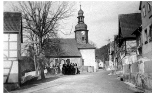
Breßwitz vor der Evakuierung Unten: Blick vom „Waldhotel am Stausee“ auf den Hohenwarte-Stausee

Unser Weg führt weiter wieder zur Saale zurück. Der in den dreißiger Jahren erbaute Saalestausee mit der Hohenwarte-Talsperre zieht viele Besucher an. Damals 1938 wurde das Dorf Breßwitz aufgegeben. Der Name, 1125 erstmals erwähnt, bedeutet ‚Birkenort‘ (von altforbisch Bresvice zu ‚breza‘ = Birke; vgl. lat. betula = Birke und vicus = Dorf). Die untenstehende Aufnahme zeigt den letzten Gottesdienst im Ort, der darauf in der Saale verschwand. Heute liegt er ca. 40 m tief unter dem Wasserspiegel der Saale.